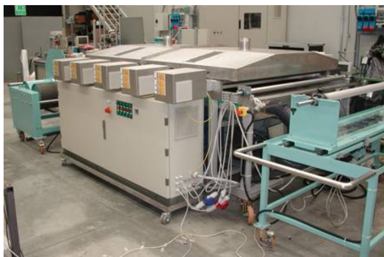
Impianto Pilota Microonde di Tecnotessile

Un nostro studio sulla resa di colorante reattivo fissato su tessuti cotonieri e lanieri in funzione del tempo di irraggiamento con forno a microonde (MW), ha dimostrato che la resa tintoriale è confrontabile a quella dei processi tradizionali a freddo (24 ore) già dopo 3 minuti di irraggiamento in forno a MW per le fibre cellulosiche e dopo 90 secondi per le fibre proteiche.